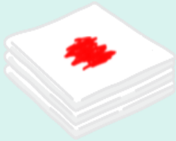
ガーゼ等の血液付着物