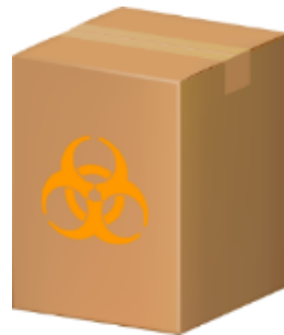
段ボール容器 (内袋使用)