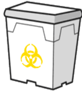
プラスチック製容器