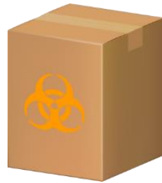
段ボール容器 (内袋使用)